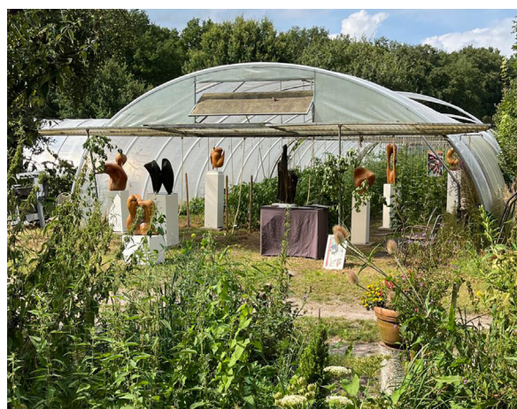
Holzskulpturen im Folientunnel

Es war ein sehr schöner, lebendiger Tag in einer freundlichen und entspannten Atmosphäre! Und wir bedanken uns ganz herzlich bei allen, die den Tag so haben werden lassen, wie er war: VIELEN DANK allen Mithelfenden wie auch allen Gästen und natürlich auch dem Wetter 😊!