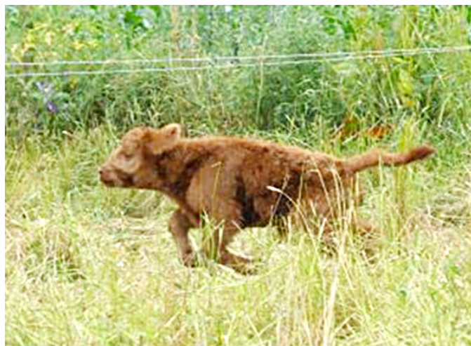
unsere „Juni“ vor 8 Jahren

Im Juni hatten wir dann mehrere heftige Gewitter und bei einem ist unsere Kuh „Juni“ (sie war 2016 unser erstes bei uns geborenes Kalb) vom Blitz erschlagen worden. Vermutlich war sie zu nahe am Zaun als der Blitz einschlug.