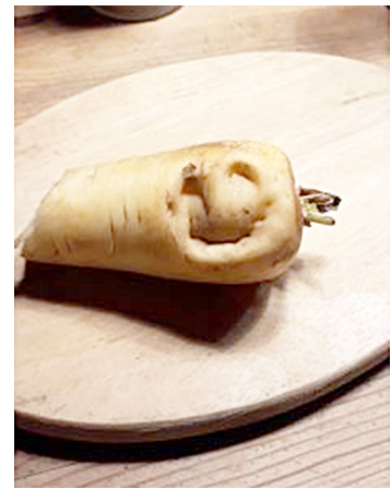
Auch Möhren können lachen! Weiße Möhre mit Gesicht

Die Salaternte war bis zum Sommer sehr gut, danach hatten sie Mühe mit dem nassen Wetter zurecht zu kommen. Gerade die geschlossenen Arten wie Kopf- und Eissalat hatten immer wieder Probleme mit Pilzkrankungen. Da wir wegen der Nässe nicht immer im 2-wöchigen Rhythmus pflanzen konnten, gab es im Spätsommer einmal einen Engpass, ansonsten hatten wir immer ausreichend Salate für den Verkauf. Bei der Möhrenernte machte sich der viele Niederschlag auch bemerkbar: Für einen Maschineneinsatz war das Möhrenlaub aufgrund von Mehлтаubefall zu schwach. Wir mussten sie also alle von Hand ernten. Die letzten Beete haben wir noch rechtzeitig vor dem Regen im November rausholen können. Die Ernte an sich ist gut, wir können bis ins Frühjahr Möhren verkaufen.