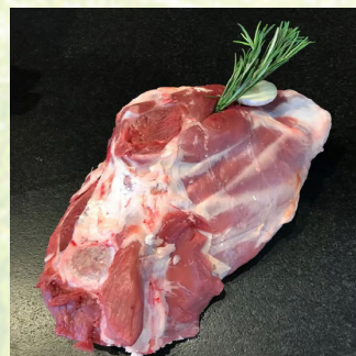
4631 Lammkeule m. Knochen/ca. 2,3 kg 56,90 €/kg