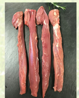
4636 Lammlachs a. d. Rücken / 250 g 109,90 €/kg