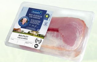
4604 Filet vom Schwein ca. 500 g 49,90 €/kg