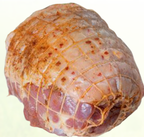
4627 Puten-Rollbraten mariniert / 1 kg 27,90 €/kg