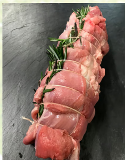
4630 Lamm-Rosmarin-Braten gerollt ca. 1 kg 64,90 €/kg