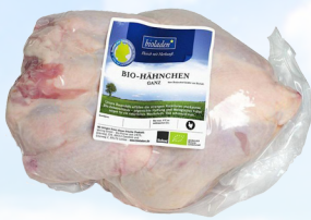
4615 Hähnchen, ganz 1,6 kg 18,90 €/kg