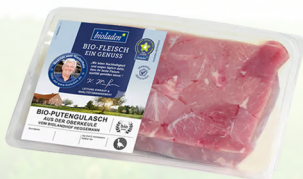
4619 Putengulasch a. d. Oberkeule ca. 400 g 33,90 €/kg