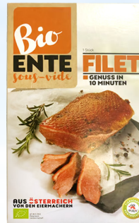
4658 Entenbrustfilet Sous-Vide 1 St. / 250 g 54,90 €/kg