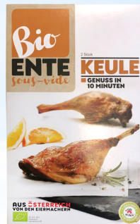
4656 Entenkeule Sous-Vide 2 St. / 480 g 33,90 €/kg