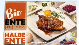
4659 halbe Ente Sous-Vide / ca. 900 g 37,90 €/kg